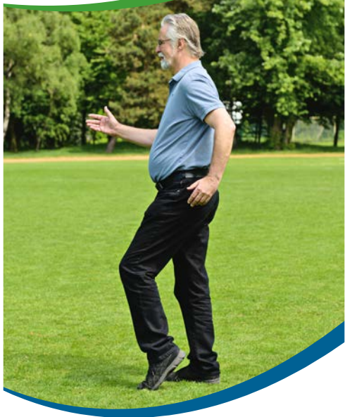
Beine und Füße (3)